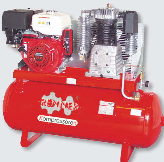
REKO 1050/50 VE