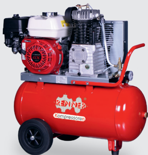
REKO 550/50 VM/VE

Die benzinbetriebenen, robusten Kolbenkompressoren bieten Ihnen neben den gewohnten Vorteilen der RENNER-Anlagen vor allem flexibel verfügbare Druckluft auf Baustellen, in Servicefahrzeugen und bei vielen weiteren Einsatzfällen "ohne Steckdose". Sie garantieren ortsunabhängig eine konstante Druckluftversorgung. Die kleine Version ist fahrbar und durch den ergonomischen Griff schnell versetzt, die große Variante lässt sich dank ihrer kompakten Bauweise mit Hubwagen oder Gabelstapler einfach bewegen und auf Fahrzeuge verladen.