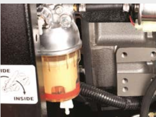
Dieselfilter mit Wasserabscheider