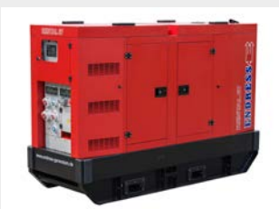
Galvanisierte Haube für erhöhten Korrosionsschutz