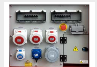
IT/TN Netzumschaltung inkl. Isolationsüberwachung und 1h Sondersteckdose zur Gebäude- einspeisung (optional erhältlich)