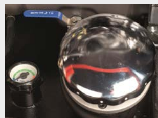
Großer Tankeinfüllstutzen mit Vorfilter und zweiter Tankanzeige