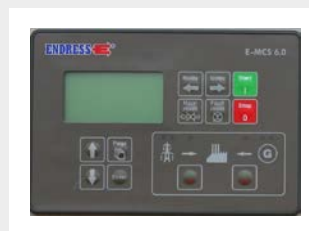
Steuerungsmodul EMCS 6 ausge- legt für Manuell- und Automatikbe- trieb inkl. Ampelfunktion für Start- Stop-System, Timer-Funktion*