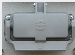
Quickconnector-Anschluß für Fernstart, Schwimmerschalter oder Umschalterschütze