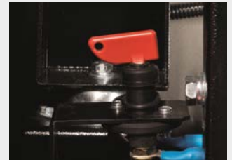
Batterie Hauptschalter für schnellen Servicezugriff*