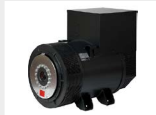
Elektronisch geregelte Hochleistungsgeneratoren