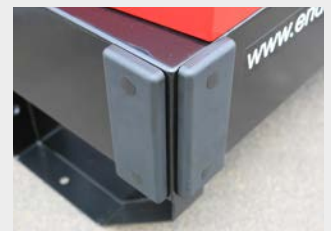
Grundrahmen mit durch- gehenden Staplerlaschen und Rammschutz