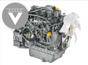
Sauber und leise arbeitende YANMAR & FPT Motoren der EU Abgasstufe Stage V