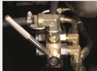
Anschluss für externe Betankung inkl. Dreiwege- kraftstoffhahn*