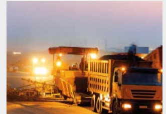
3-facher Anlaufstrom für schweranlaufende Verbraucher*