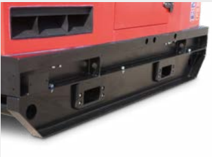
Großer Stahltank für Laufzeiten von 24-50 St. und Flüssigkeits- auffangwanne mit Leckagewarner zum Schutz der Umwelt*