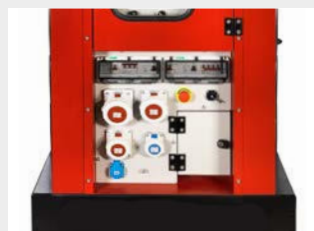
Schalttafel IP54 nach aktueller Fassung der DGUV 203-032 Berufsgenossenschaft inkl. Klemmleiste