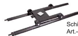
Schienensystem Art.-Nr. 530004102